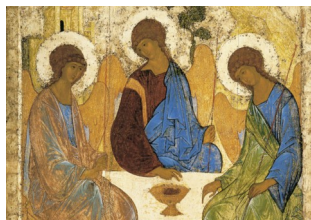
Andrej Rublëv, TRINITA'

Venti di rinnovamento per la vita religiosa